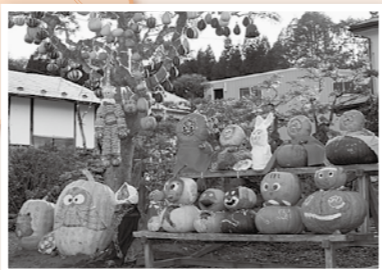
⑩ 第29回 戸田かぼちゃ祭り