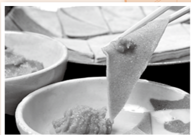
⑬ オドデ館 秋の収穫祭&新蕎麦かつげ祭り