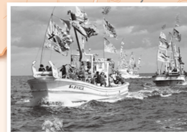
⑪ 2018 海フェスタ in ふだい