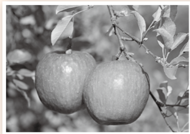
④ 金田一温泉観光りんご園収穫祭

久慈広域観光協議会事務局 (岩手県久慈市中央 3-38-2) TEL.0194-53-5756 FAX.0194-66-8006