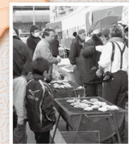
⑭ 野田ホタテまつり